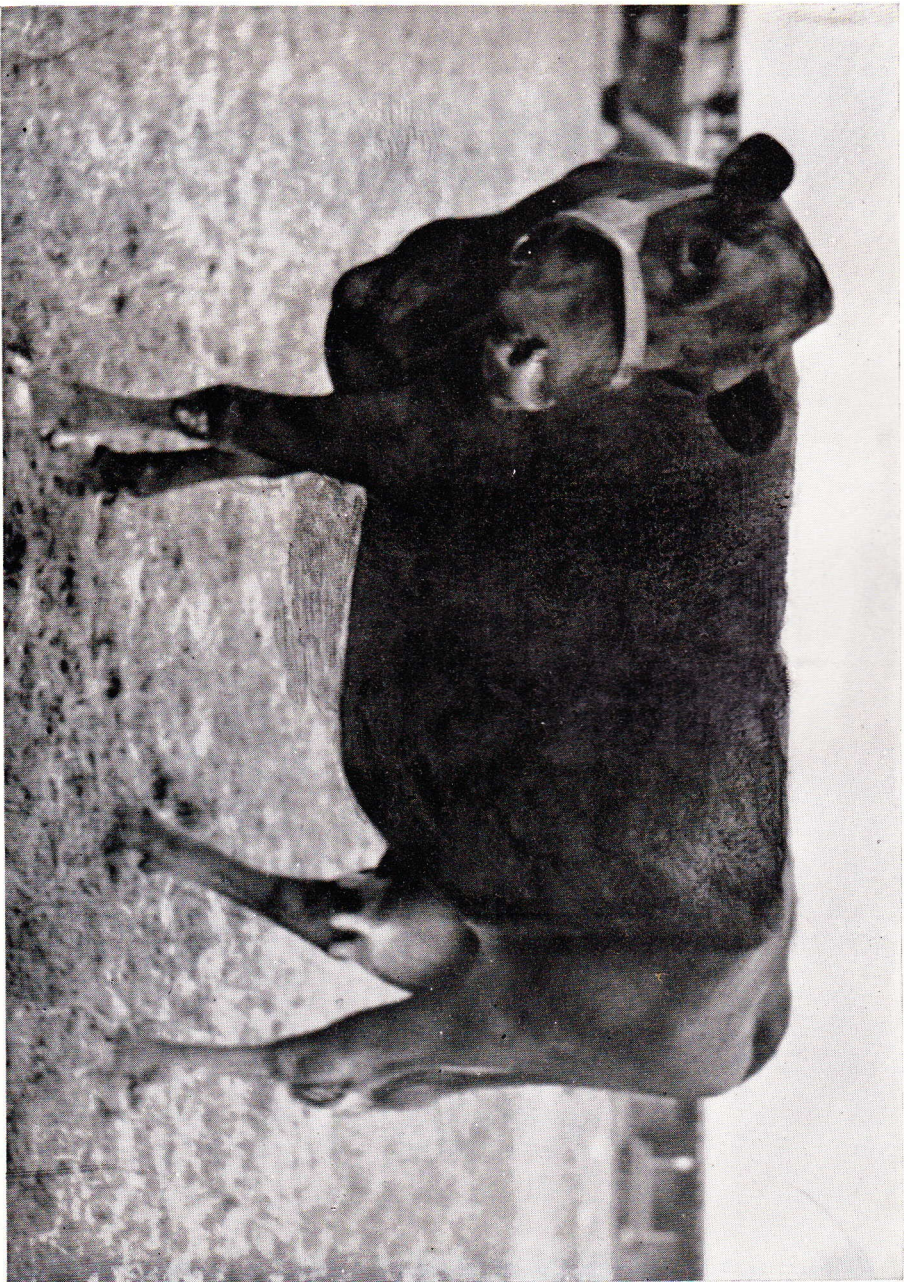
28 Prima, R. K. V 06515. Ägare: Lindsbergs Försörjningshem, Bergsgården.