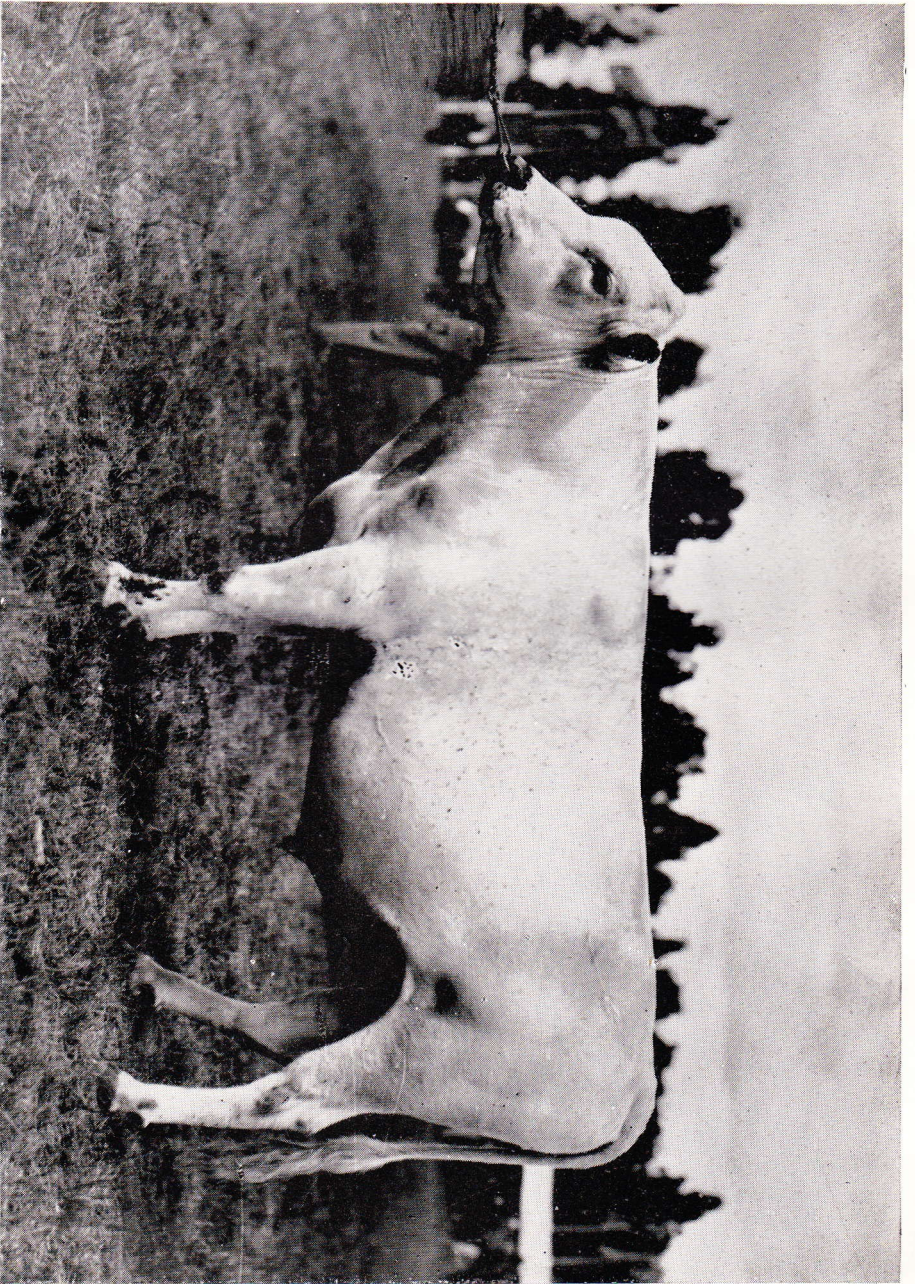
Svenning, R. 4384. Ägare: Ale Tjurförening, Ale.