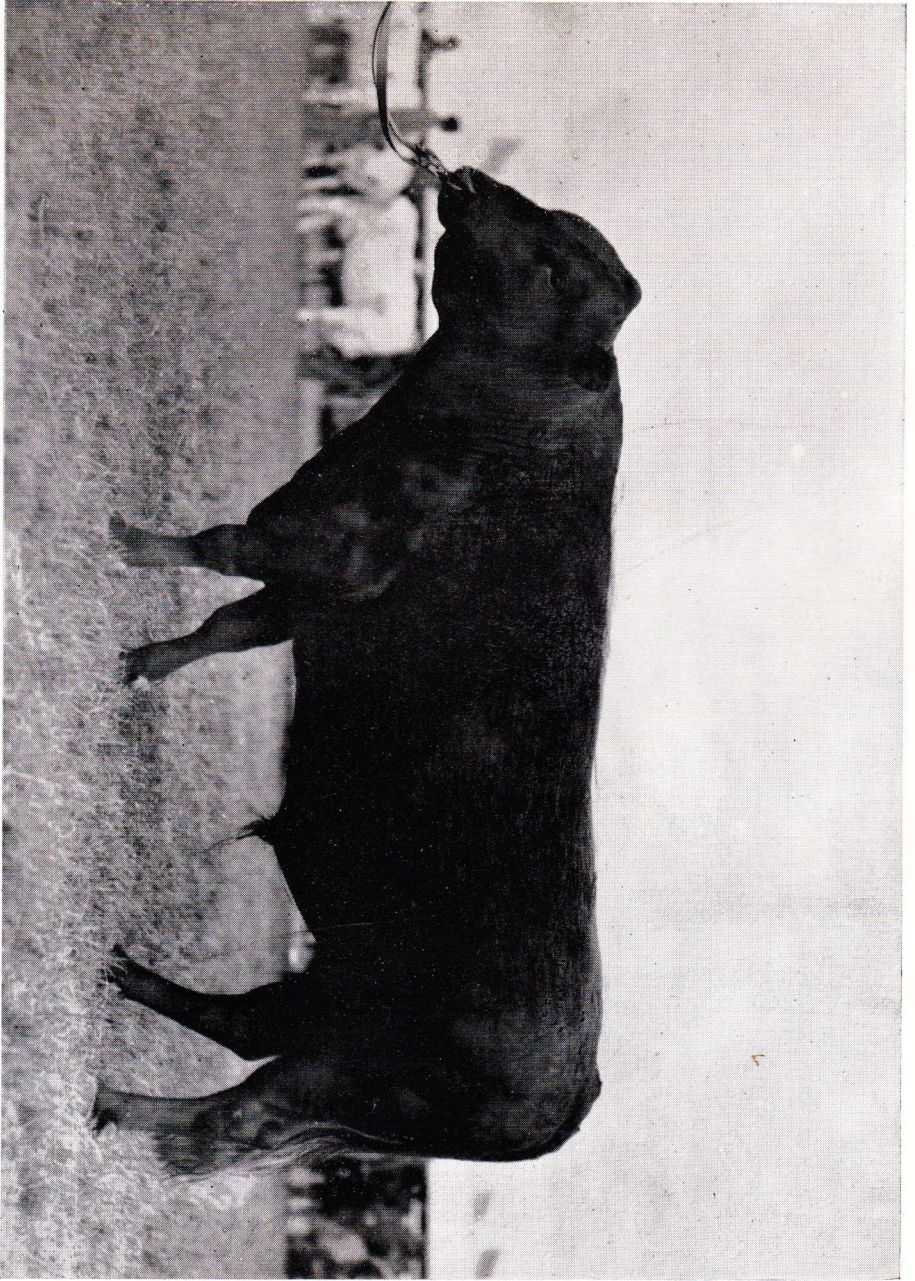
40 Gullrik, R. K. 316. Ägare: Leksands Avelsförening, Häradsbygden.